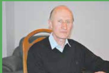
Rozmowa z Przewodniczącym Rady Gminy str. 6