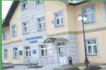
Przychodnia z zaufaniem pacjenta str. 8