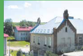
W szkołach jeszcze ciepłej str. 2