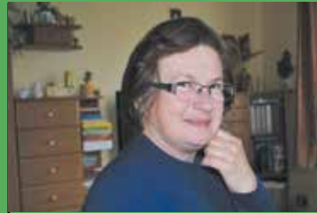
Seniorki cieszą się życiem str. 8